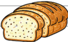
Tam tahıllı ürünler