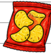
Cips ve paketli atıştırmalıklar