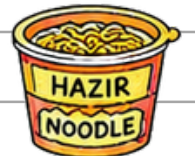
Hazır ve paketli gıdalar