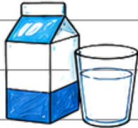
Süt ve süt ürünleri