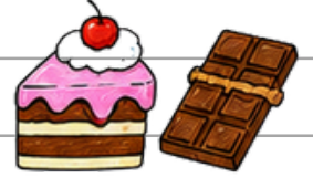
Tatlılar ve şekerlemeler