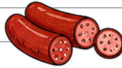
İşlenmiş et ürünleri