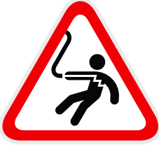
Elektrik Çarpma Riski